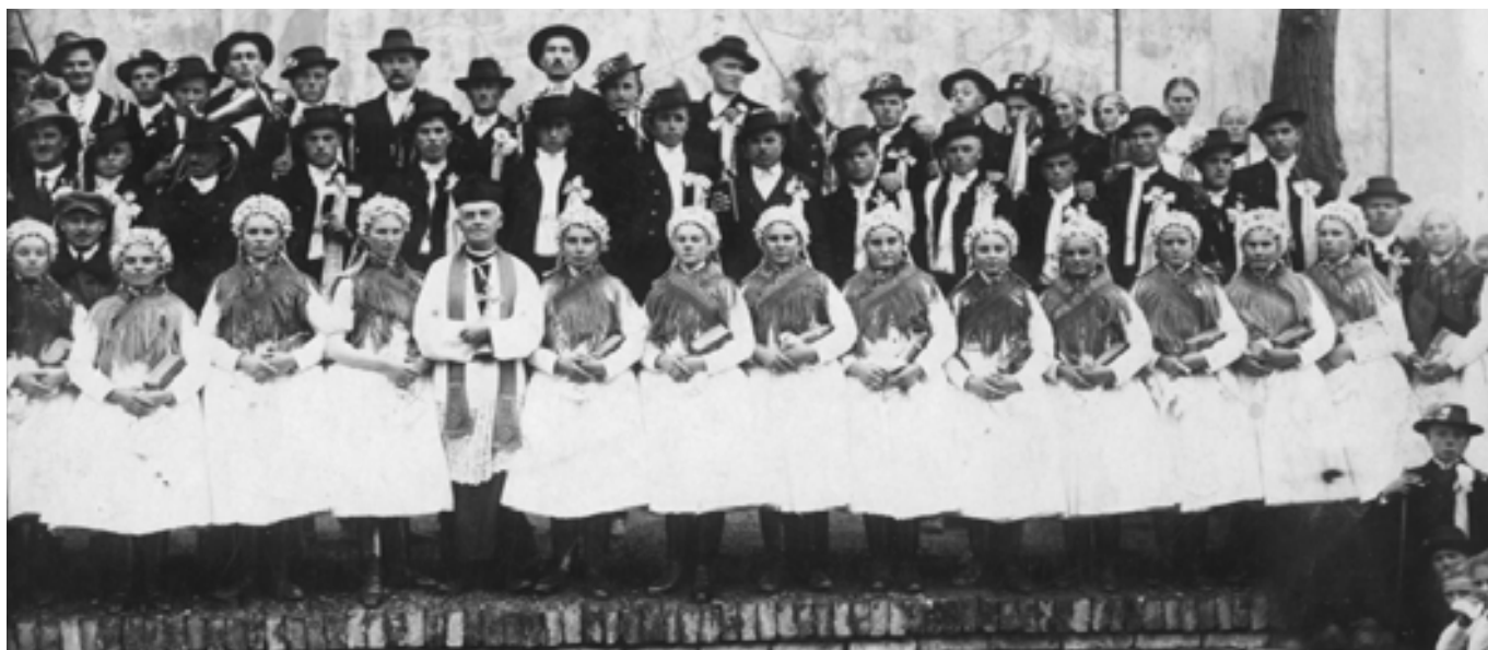
Az 1928. november 3-án Sződön házassult 20 házaspár adatai