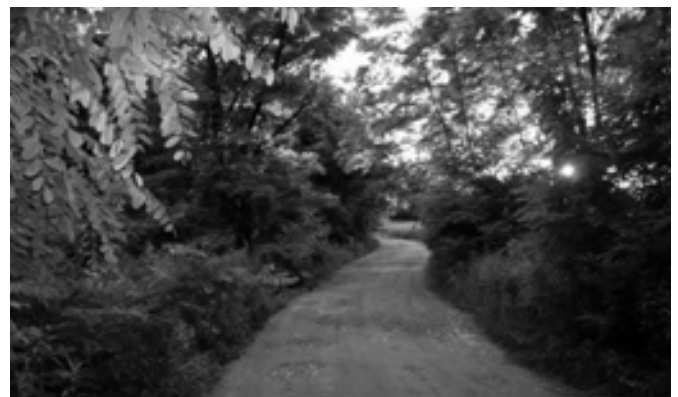
A megtisztult a kiserdő

A legutóbbi eset október 6-án történt, mikor egy kisebb utánfutónyi frissen lerakott szemétkupacban olyan névvél és címmel ellátott borítékokat és postai csekket találtak, amely alapján egyértelműen beazonosítható hogy a szemet kitől származik.