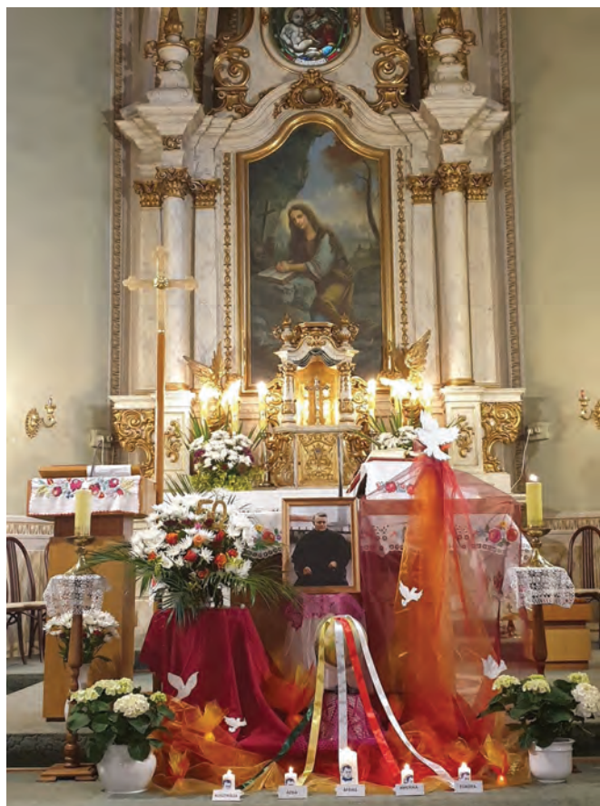
Ünnepi díszben az oltár