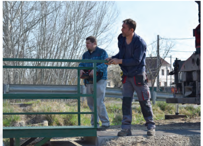
Figyelni kell, hogy jó helyre kerüljön a híd

lyázatokon elnyert összegekkel. A jelentős többletbevétel az előző évi takarékos gazdálkodásból, valamint a pályázatokon elnyert, folyamatban lévő beruházási támogatások fel nem használt összegéből ered. A megtakarításaink lehetővé teszik, hogy ebben az évben is önerős önkormányzati beruházásokat tudjunk megvalósítani, valamint olyan pályázatokon is indulni tudunk, ahol szükséges az önkormányzati önerő. Ebben az évben több ilyen jellegű beruházást tervezünk, és több ilyen pályázaton veszünk részt. 2021. évben is a lehetőségeinkhez mérten részt veszünk a közmunkaprogramban. A közmunkaprogramban egyre kevesebb a foglalkoztatható személyek száma. Azok, akik ebben a programban részt vesznek, azon személyek munkahatékonyasága meglehetősen