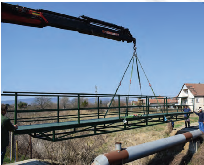
Gyalogos hidak beemelése

Mint az előző számban írtuk, az irrattár építése a bölcsöde bővítése miatt válik szükségessé. Ahhoz, hogy a bölcsödebővítési beruházást