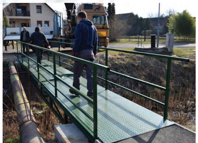
Ez a híd már a helyén van