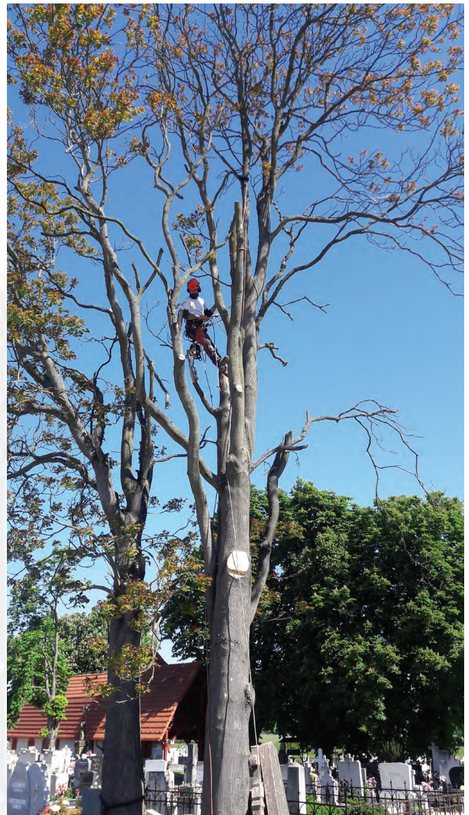
A temetőben alpinista technikával vágják ki a fákat

Önkormányzatunk sikeres pályázatot nyújtott be az Önkormányzati feladatellátást szolgáló fejlesztések támogatása c. pályázati kiírás keretén belül a Rákóczi Ferenc utca Pacsirta utcától a József Attila utcáig terjedő szakaszának felújítására. A felújítás a Rákóczi Ferenc utca első szakaszának megfelelő műszaki tartalommal történik. A felújítás során (a Pacsirta utcától a József Attila utca felé haladva) az út bal oldali részén található árkokat szükség szerint újra ássuk, (a bejárók alatti csőátereszek tisztítása az ingatlan tulajdonosok feladata lesz), az úttest két oldalát szegélykövel látjuk el, a jobb oldalon az úttesttől a kerítésig terjedő szakaszt mur-