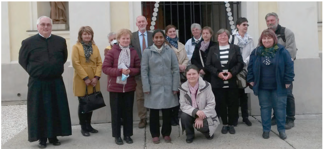
Szentmise után „családi” fotó