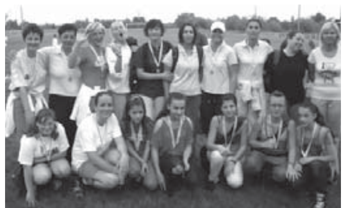
▲ A felnőtt és a IV. korcsoportos kézilabda csapatok

Vác Földváry Szód Felnőtt Szód IV. korcsoport