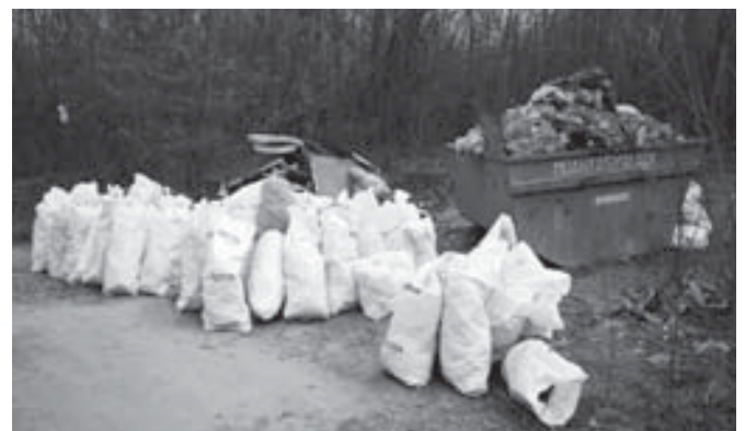
A sok megtelt zsák a szorgos munka gyümölcse