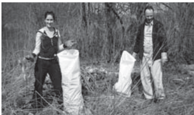
Valahonnan ismerős arcok...