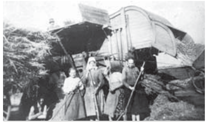
Szódiak a cséplőgép mellett (kb. 1940)

földterületet szántóföld, szőlő, rét, erdő és belterületi telkek alkották. Mivel apám akkoriban nem kívánt parasztgazdasággal foglalkozni a legtöbb gond a földek megművelésével az anyámra hárult. Ebben jómagam is kivettem a részemet, ahogy azt az iskolai kötelességeim megengedték. Az anyámmal eljártam a táblai-, tarcsai-, csapási-, hosszúti-, neveli-dűlőbe és még más nevezetű földekre a szódi határban burgonyát, kukoricát, babot ültetni, kapálni és a termést felszedni. A konopnyiszközi-dűlőben többnyire zöldségféléket termesztettünk, mert a locsolásra közel volt a Tece-patak. A termés feleslege a váci, szódligeti és a felsőgödi piacon volt az anyám által értékesítve. Részt vettem a széna gyűjtésében is a nyilasi és a jakabkai réteken. A tűzifát a debegi erdőből és a Tinódi élelmiszerüzlet mellett