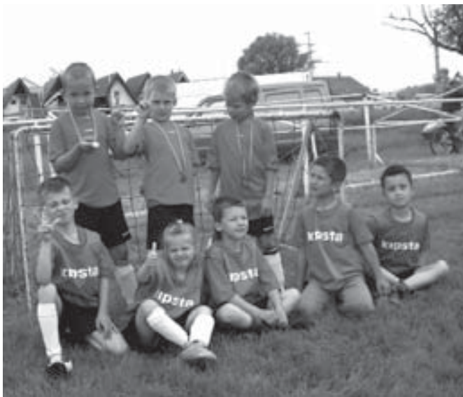
▲ ▼ A győztes ovis csapat – Püspökszilágy

Arany: Dunakeszi Kinizsi 1. Ezüst: Vác 2. Bronz: Szód 1. IV. hely: Göd Dunakanyar 2. V. hely: Vác 1. VI. hely: Göd Dunakanyar 1. VII. hely: Dunakeszi Kinizsi 2. VIII. hely: Szód 2. IX. hely: Felsőgöd